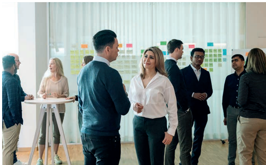
Konferenz bei Vattenfall: Dialog ist der Schlüssel der Klimakommunikation.

Der Klimawandel betrifft uns alle, doch die Flut alarmierender Nachrichten führt oft zu Desensibilisierung und Resignation. In der Berichterstattung wird der Fokus zu oft auf Hindernisse und Probleme gelegt und nicht auf die Möglichkeiten wie Innovation und neue Arbeitsplätze, die Klimaschutzmaßnahmen auch bieten. Können wir die negativen Auswirkungen des Klimawandels ansprechen und gleichzeitig hoffnungsvoll in die Zukunft blicken?