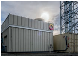
Von Außen unscheinbar: die Wärme-Batterie.