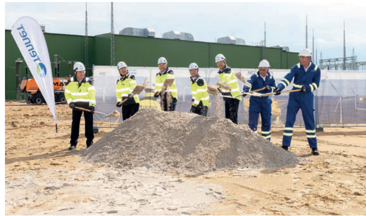
Baustart: In Büttel errichtet TenneT den neuen Offshore-Netzanbindungspunkt.

sierung von Systemen und Prozessen voran. TenneT entwickelt auch innovative Technologien, um Netzanschlüsse noch effektiver und kosteneffizienter zu gestalten. Eine dieser Innovationen ist der 66-kV-Direktanschluss, der auch beim Projekt BorWin6 zum Einsatz kommt. Diese Technologie ermöglicht erhebliche Kosten-