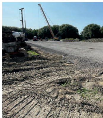
Die Pfahlgründungsarbeiten am Kernkraftwerk Brokdorf sind angelaufen.

Die TBH wird auf 140 Pfählen gegründet, die jeweils einen Durchmesser von 1,5 Metern und eine Länge von 25 Metern aufweisen. Die Errichtung der Pfähle erfolgt über ein spezielles, suspensionsgestütztes Verfahren. Bei dieser Technik wird die Bohrwandung durch eine Flüssigkeit stabilisiert, die später durch Frischbeton verdrängt wird. Dieses Verfahren gewährleistet, dass die Pfähle auch in anspruchsvollen geologischen Bedingun-