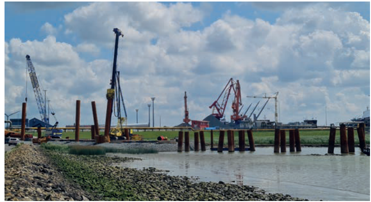
Ramarbeiten für den neuen LNG-Anleger, die Jetty, im Elbehafen Brunsbüttel.

Um den Hafen- und Industriestandort Brunsbüttel mit seinen zahlreichen Unternehmen aus der Chemieindustrie langfristig wettbewerbsfähig und nachhaltig zu gestalten, engagieren sich die Industrieunternehmen des ChemCoast Park Brunsbüttel gemeinsam für den Einsatz innovativer klimaschonender Technologien wie CCS und CCU. Zudem setzen sie sich für den verstärkten Import von erneuerbaren Energieträgern und den Export von unvermeidlichem CO 2 aus der Industrie im Norden ein. «Diese Entwicklung ist für uns als Hafeneigentümer von großer Bedeu-