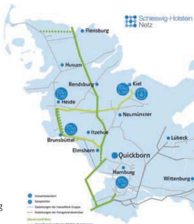
Aktueller Antrag für das Wasserstoff-Kernnetz in Schleswig-Holstein.

Die Genehmigung und Veröffentlichung der beantragten Planungen zum Wasserstoff-Kernnetz erfolgen voraussichtlich Ende 2024 durch die Bundesnetzagentur. Erst dann ist konkret abzusehen, welche Gasleitungen zuerst umgestellt werden und Teil der neuen Wasserstoff-Autobahnen sind.