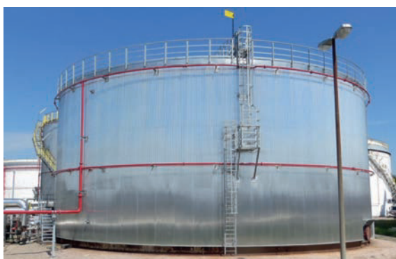
Zur Reduzierung der Wärmeenergie-Verluste hat TotalEnergies die Tankisolationen erneuert.

Seit 2015 konnte außerdem der Ausstoß von CO 2 um 26 Prozent gesenkt werden. TotalEnergies ist bestrebt, diese Ergebnisse kontinuierlich zu optimieren – mit dem Ziel, bis 2030 eine Reduzierung des CO 2 um 55 Prozent und bis 2050 die Netto-Null bei