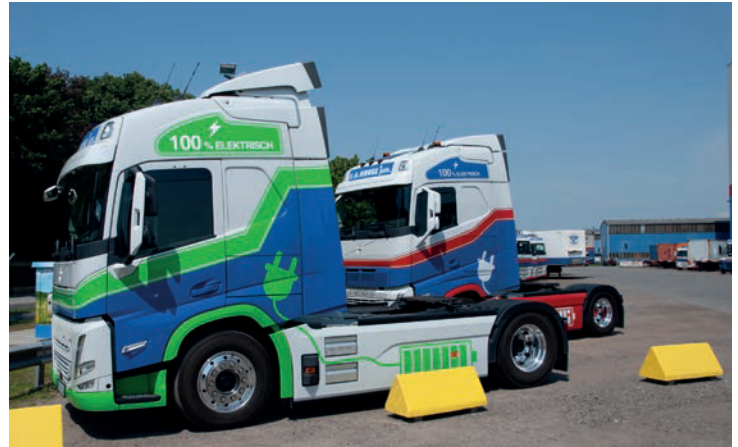
«100 Prozent elektrisch»: Zugmaschinen der Spedition Kruse.

Darüber hinaus setzt das Unternehmen weitere Maßnahmen zur CO 2 -Reduktion um. Neben der Elektrifizierung des Fuhrparks modernisiert die Spedition auch ihre Diesel-Flotte und stellt schrittweise auf den Einsatz von Bio-LNG um. Diese Maßnahmen tragen entscheidend dazu bei, den CO 2 -Ausstoß pro Kilometer der gesamten Flotte bis Jahresende im Vergleich zu den Jahren 2021 und 2022 um rund ein Drittel zu reduzieren. «Unser Ziel ist es, den ökologischen Fußabdruck unseres Unternehmens nachhaltig zu verkleinern, ohne dabei an Leistungsfähigkeit ein-