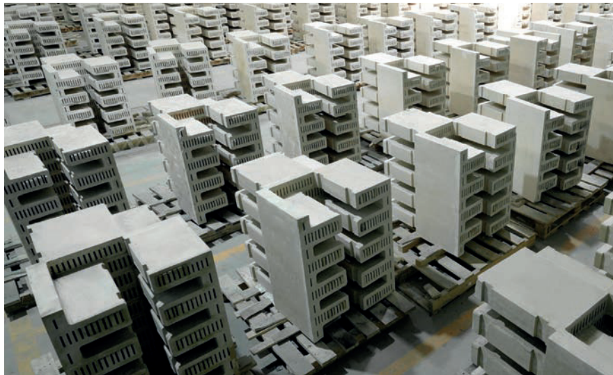
Herzstück der Wärme-Batterie: Mit Hilfe von Ziegelsteinen wird elektrische Energie gespeichert.

Die von Bill Gates gegründete Stiftung «Breakthrough Energy Catalyst» und die Europäische Investment Bank (EIB) sponsern den Einbau der RHB100 Wärme-Batterie, die am Covestro-Standort in Brunsbüttel Ende 2026 in Betrieb gehen soll. Das Projekt wird dann zehn Prozent des benötigten Dampfes am Standort produzieren, was bis zu